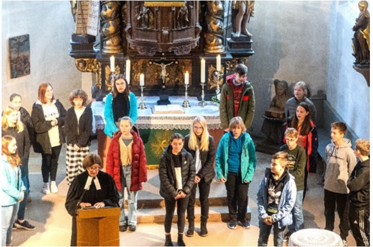
Konfis in Aktion am Volkstrauertag

In der Kriegs- und Krisenzeit unserer Tage ist das Gebet um Frieden besonders wichtig. Die Baiersdorfer Konfirmanden gestalteten einen „Klage-Teppich“, der unter die Haut ging. Er brachte lautstark vor Gott, was von Kriegen bedroht ist, beschädigt ist, zerstört wurde. Am Ende des Gottesdienstes entließen sie die Gemeinde mit Friedensworten aus aller Welt.