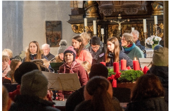
Das Ensemble „Holzklang“ in Aktion.

Das Christkind eröffnet den Markt auf den Stufen der Stadtpfarrkirche.